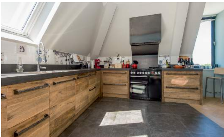
De houten keukens werd gemaakt door Restyle XL. De handvaten werden door Kunstmederij Axel van der Horst op maat gemaakt.