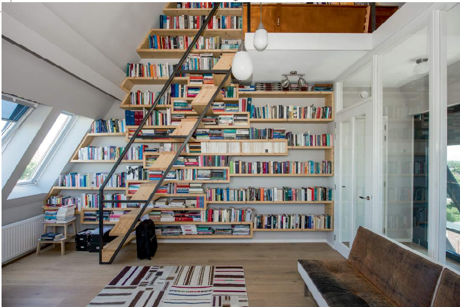
De op maat gemaakte boekenkast reikt tot aan het plafond. Michel Brands Architectuur maakte dit beeldbepalende wandmeubel en realiseerde ook de trap die naar de tweede verdieping leidt.