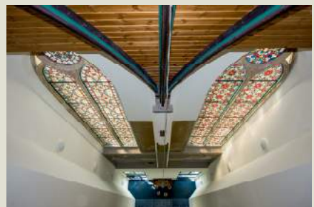
Glas in lood ramen gemaakt door Jilleba.