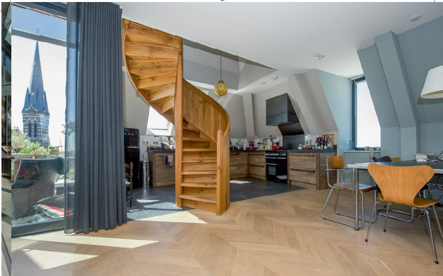
De vloer van Belgisch hardsteen in de keuken kochten de bewoners bij Middelkoop in Culemborg. De houten vloer in Hongaarse punt is afkomstig van Fairwood.