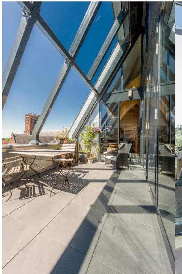
Het zonnige terras biedt een prachtig uitzicht op het centrum van Culemborg.