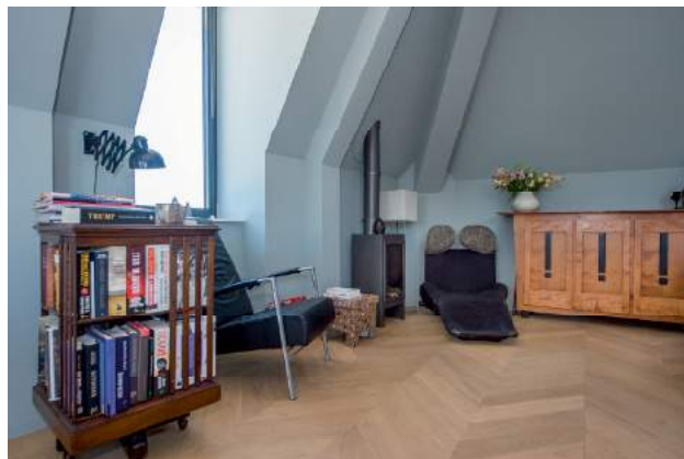
Alle deuren, ramen en hang-en sluitwerk werden door Deur- en Design Centre Culemborg verzorgd.