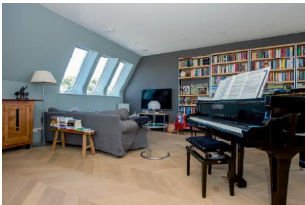
Serbee Schilderwerken zorgde voor al het schilderwerk in het penthouse.